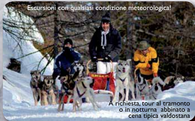
Escursioni con qualsiasi condizione meteorologica!

Da che età si può provare? Anche i nostri piccoli amici hanno la possibilità di condurre la slitta (da soli o accompagnati). Età minima 7 anni. I più piccoli, comunque, potranno essere trasportati all'interno della slitta della guida.